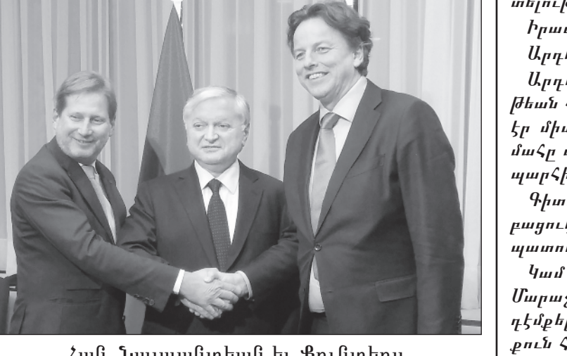
Հան, Նալպանտեան եւ Քուստերս

Երէկ, Պրիւքսէլի մէջ տեղի ունեցաւ Հայաստան-Եւրամիութեան համագործակցութեան խորհուրդի 16-րդ նիստը: Եւրոպական պատուիրակութիւնը գլխաւորեցին Եւրամիութեան խորհուրդի նախագահ-Տիւրքիոյ ներկայացնող Հոլանտայի Արտաքին գոր-ծոց նախարար Պերթ Քուստերս եւ Եւրոյանմասնո-ղովի հարեւանութեան քաղաքականութեան եւ ընդ-լայնման հարցերով յանձնակատար Եոհաննէս Հան: Հայկական պատուիրակութիւնը գլխաւորեց Հայաս-տանի Արտաքին գործոց նախարար Եղուարդ Նալ-պանտեան, որու կողքին էին ԵՄ-ի մօտ Հայաստանի առաքելութեան ղեկավար դեսպան Թաթուլ Մարգա-րեան, Տնտեսութեան առաջին փոխ-նախարար Գա-րեգին Մելքոնեան, Արդարադատութեան փոխ-նա-խարար Վիգէն Բոչարեան եւ այլ պաշտօնատարներ: