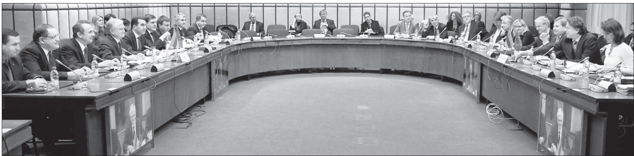
Դրուագ մը Պրիւնտի մէջ երէկ տեղի ունեցած Հայաստան-Եւրոմիութիւն համագործակցութեան խորհուրդի 16-րդ նիստի բանակցութիւններէն