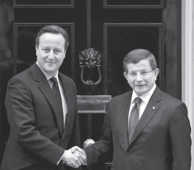
Տէյվիտ Քեմըրը եւ Ահմէտ Տավուտօղլու

Երկու երկիրներու վարչապետները՝ Աճմէտ Տավուտօղլու եւ Տէյվիտ Քեմըրը երէկ ունեցան կարեւոր տեսակցութիւն մը